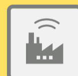
ГУДКИ ПРЕДПРИЯТИЙ И ТРАНСПОРТНЫХ СРЕДСТВ