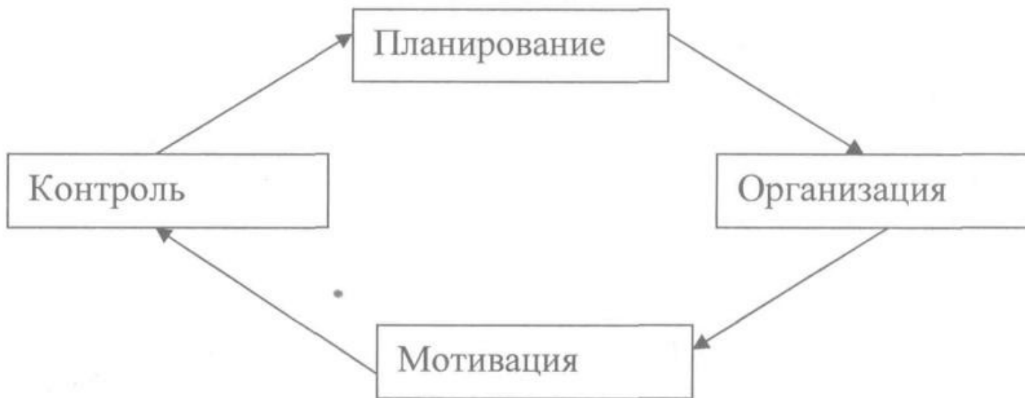
Рис.1. Цикл менеджмента