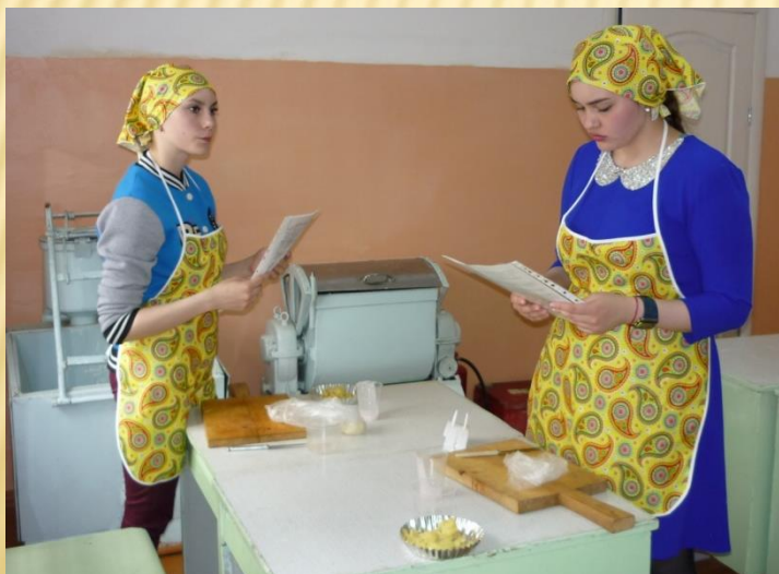
Учащиеся 10 а класса, школы №5