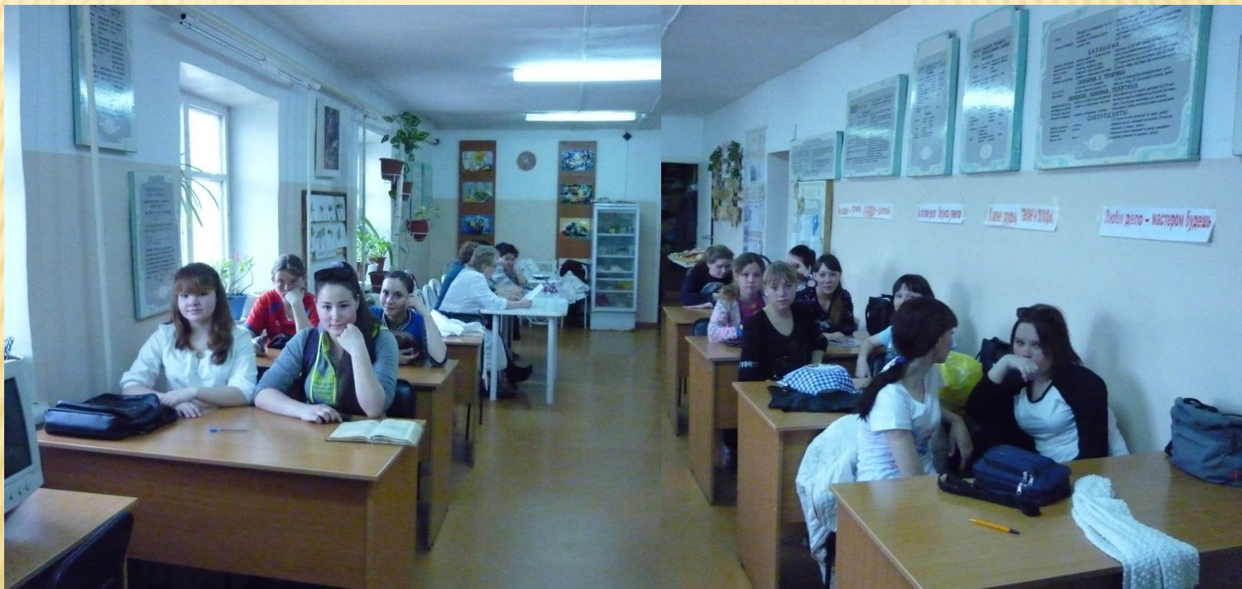
ГБПОУ «ГЭТ», 2 корпус , учебные кулинарный и кондитерские цеха