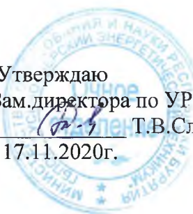
График проведения промежуточной аттестации за 7 семестр 2020-2021 уч.г. Специальность 13.02.03 «Электрические станции, сети и системы» группа 27-1а, 27-1б